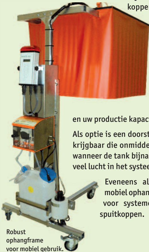
Robust ophangframe voor mobiel gebruik.

Eveneens als optie is een mobiel ophangframe leverbaar voor systemen met 1 of 2 spuitkoppen.